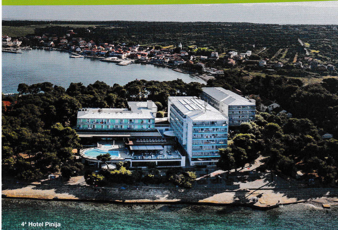
4* Hotel Pinija